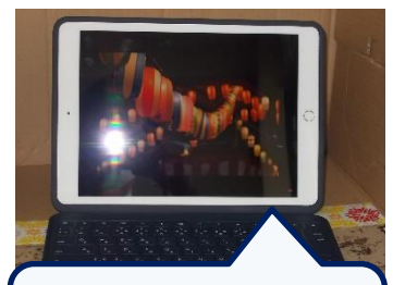
夏祭りのBGMで ふんいきづくり！

新学習指導要領では、これからの時代に必要な学力として、①「知識及び技能」、②「思考力・判断力・表現力」、③「学びに向かう力、人間性」と整理されました。本校児童の様子を見ていると、特に②や③の力の育ちを感じます。